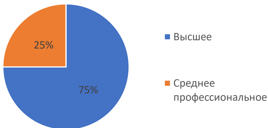
Распределение педагогов по уровню квалификации